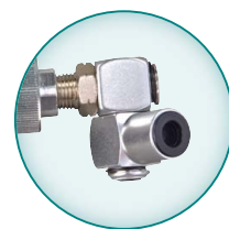
Otočný spojovací kloub