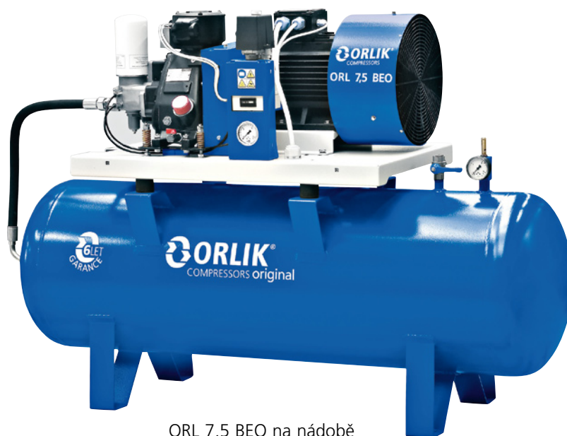
ORL 7,5 BEO na nádobě

Šroubové kompresory typové řady ORL EO jsou určeny pro trvalý provoz s plně automatickým systémem řízení chodu kompresoru v závislosti na odběru stlačeného vzduchu. Jedná se o kompresory šroubové s jednostupňovým šroubem, mazané olejem. Zásobník oleje je integrován přímo do bloku kompresoru. Blok zabezpečuje další funkce: hrubé odlučování oleje ve skříně, jemnou separaci, filtraci oleje, udržování min. tlaku včetně filtrace a regulace nasátého vzduchu. Blok kompresoru a elektromotor jsou připevněny k rámu.