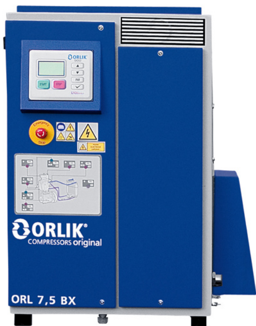
Provedení X s řídicí jednotkou