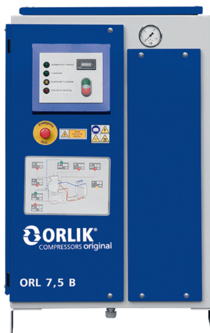
Provedení E s reléovým řízením