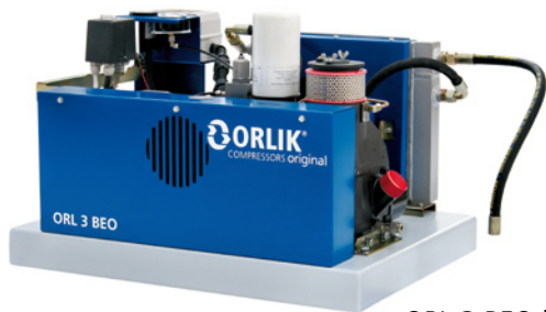
ORL 3 BEO bez nádoby