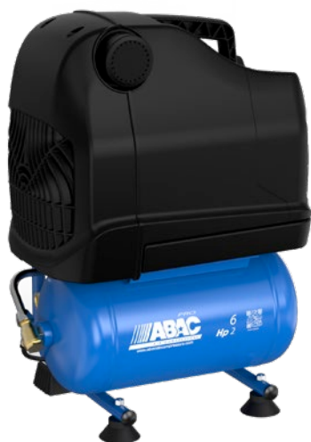
OSS20P-1,5-6RM 1,5 kW; vzdušník 6 litrů

Bezolejové profesionální kompresory s přímým pohonem v přenosném a mobilním provedení určené pro menší řemeslnické aplikace.