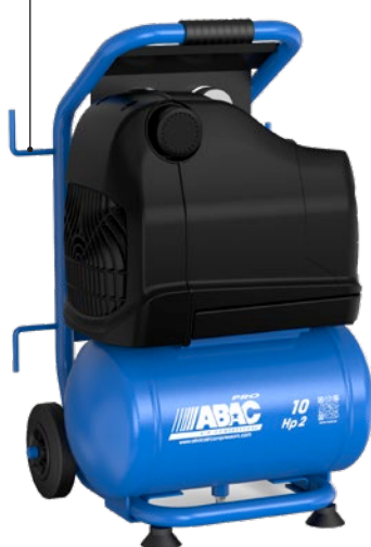
OSS20P-1,5-10RM 1,5 kW; vzdušník 10 litrů

Praktické háčky pro zavěšení kabelů a hadic